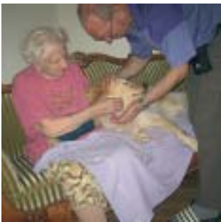
Amira bei einer Heimbewohnerin

In der letzten Ausgabe durfte ich bereits einen Artikel über Tiere als Therapeuten in unserem Heim publizieren. Da dieses Jahr ganz unter dem Motto «Tiere» steht, möchte ich heute die Gelegenheit nutzen, über den Einsatz eines Therapiehundes in unserem Heim zu berichten.