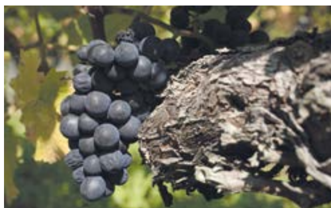
Pinot noir kurz vor der Ernte.

Geerntet wurde vom 13. September 2018 bis am 21. September 2018. Malbec und Merlot wurden nachträglich geerntet.