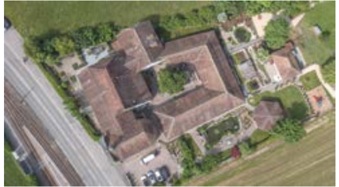
Luftaufnahme Alters- und Pflegeheim St. Katharinen.

Wiederum hatten wir relativ viele Krankheitsabsenzen. Auffallend ist, dass trotz guter personeller Abdeckung (über den kantonalen Vorgaben) die psychische Belastung nicht zu ver-